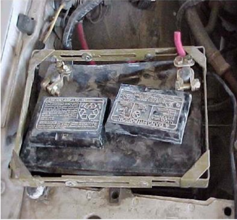
5. Be nem kötött akkumulátor, mely...