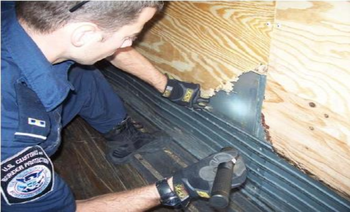
3. Sérült oldalfal belülről