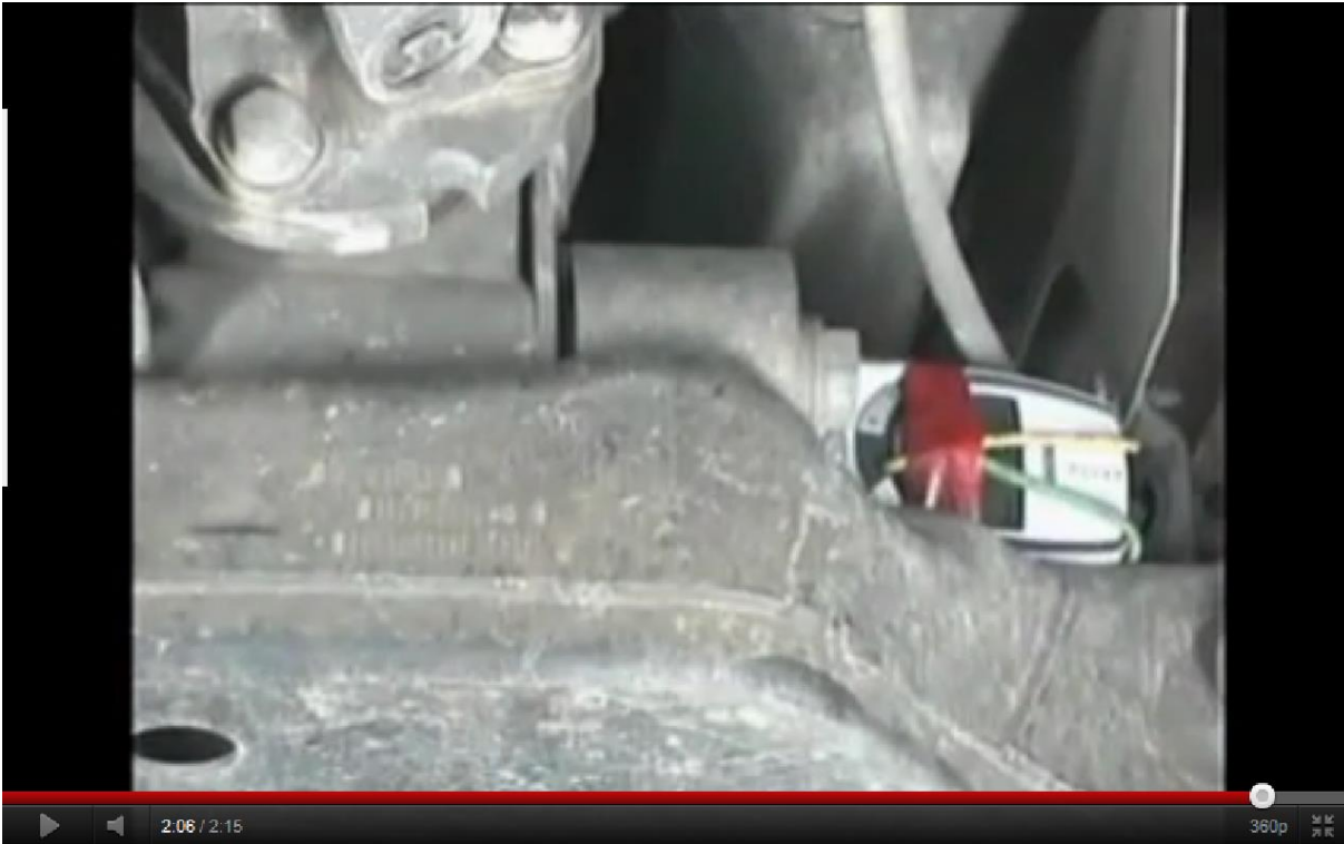
1. Alvázra szerelt időzítő szerkezet