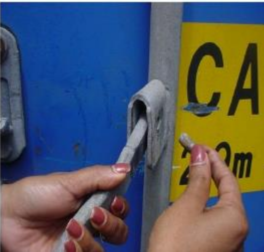
7. Nem gyári, oldható kötések a záron és plombafüleken