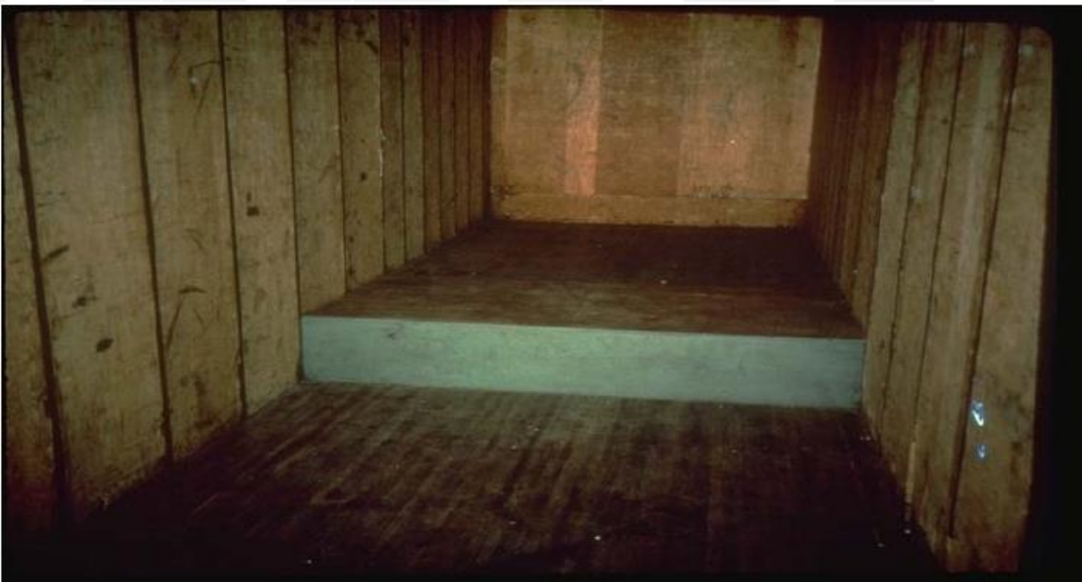
4. Hamis dobogó a raktérben