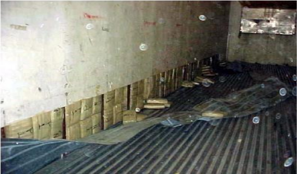
6. Hamis oldalfal, mely egyben rejtekhely is