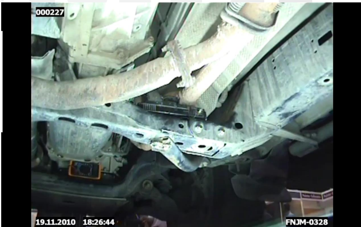
2. Alvázra rejtett lőfegyver